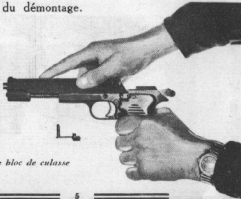
Enlever le bloc de culasse

Le remontage se fait en sens inverse du démontage.